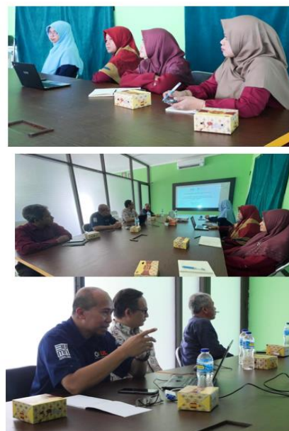
Gambar 3 Dokumentasi kegiatan PkM

Di bawah ini disajikan foto-foto selama kegiatan demonstrasi aplikasi dan pelatihan penggunaan aplikasi perpustakaan digital: